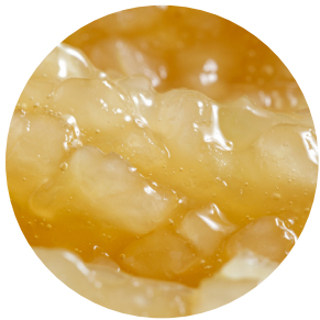
Topfil Apple 35 % 12 kg Bäko varenr.: 215434