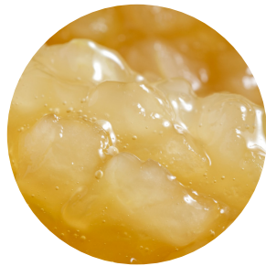
Topfil Apple 90 % 15 kg Bäko varenr.: 213116