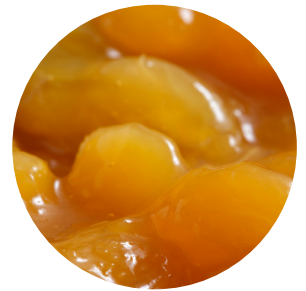
Topfil Apricot 60 % 5 kg Bäko varenr.: 213204