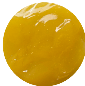
Topfil Citrus 70 % 12 kg Bäko varenr.: 215542