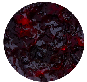
Topfil Black Currant 60 % 12 kg Bäko varenr.: 215541