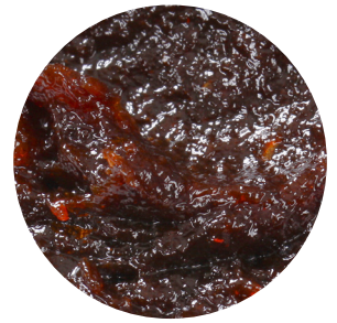
Topfil Prune 40 % 12 kg Bäko varenr.: 215435