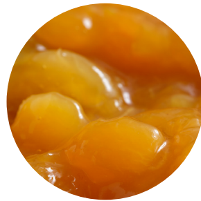
Topfil Apricot 45 % 12 kg Bäko varenr.: 215434