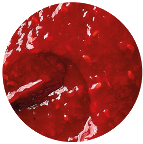
Topfil Raspberry 35 % 12 kg Bäko varenr.: 215436