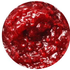
Topfil Raspberry 50 % 12 kg Bäko varenr.: 215438