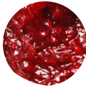
Topfil Raspberry 60 % 14 kg Bäko varenr.: 213114