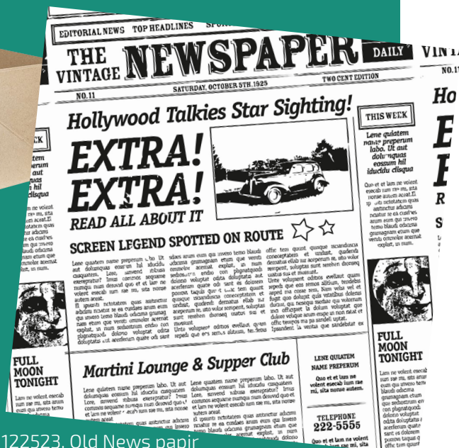
122523, Old News paper