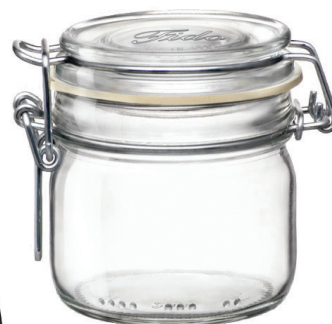
113480, Patent glas