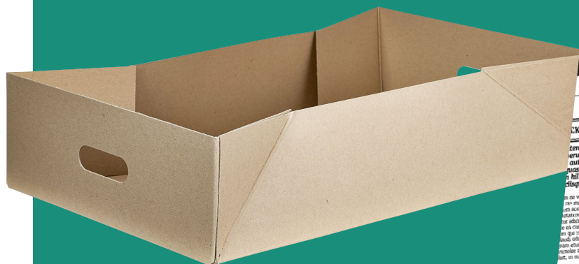
103121-1, Papkasse med håndtag.