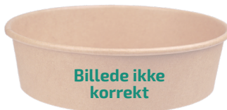
Billede ikke korrekt

123210 Salatskål rund 500 ml karton bionedbrydlig 117232 Plastlåg Ø150 mm Bionedbrydlig