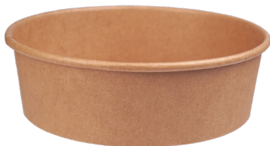
121280-1, brun skål 500 ml. Fås også i andre størrelser 121284-1- Plastlåg.

123210 Salatskål rund 500 ml karton bionedbrydlig 117232 Plastlåg Ø150 mm Bionedbrydlig